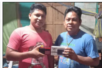
Povo Ticuna Recebendo o mp3 - Amazonas