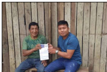
Povo Wai-Wai Recebendo os mp3 - Roraima