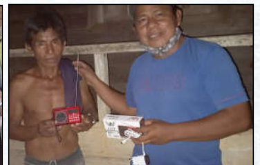
Povo Ticuna Recebendo o mp3 - Amazonas