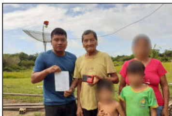
Povo Wai-Wai Recebendo os mp3 - Roraima