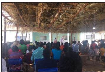
Povo Xavante - MT Primeira entrega dos mp3