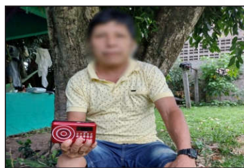
Povo Wai-Wai Recebendo os mp3 - Roraima