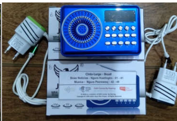
Povo Cinta-Larga Recebendo o primeiro Mp3