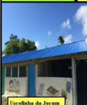
Escolinha da Jocum