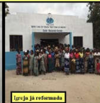
Igreja já reformada